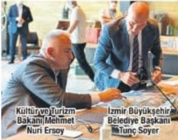
Kültür ve Turizm Bakanı Mehmet Nuri Ersoy

"Bu proje bölgeyi ranta açmayacağı gibi Çeşme Yarımadası'nı korumaya alacak. Çeşme'yi dünyanın sayılı destinasyonları arasına almakla kalmayacak, hoyratça yağmalanmasını engelleyecek bir proje. Proje alanının yaklaşık yüzde 93,5'i kamu alanı. Proje kapsamında sahiller, geniş bir band genel kullanıma açık olacak. Denize sıfır turizm tesisi yapılmayacak. Spor turizmi alanları, termal ve sağlık turizmi merkezleri, agro turizm, doğa turizmi, kültür-sanat mekanları ve sergi salonları, kongre, fuar ve etkinlik merkezleri tesislerin arkasındaki alanlarda yer alacak. Eğlence alanlarıyla dinlenme alanları birbirinden ayıran proje yıllardır tartışmalarla süren bir sorunu da çözüme kavuşturacak."