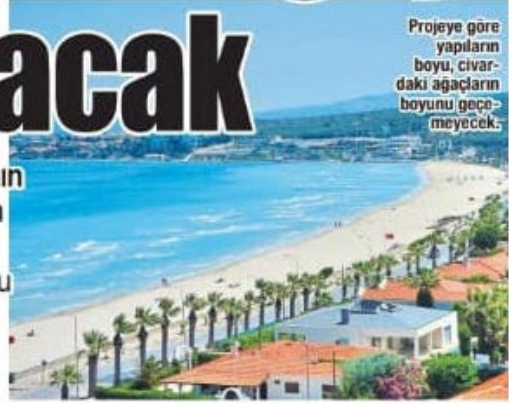
Projeye göre yapıların boyu, civardaki ağaçların boyunu geçmeyecek.