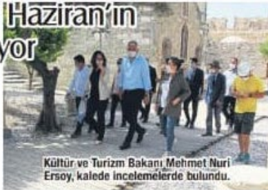
Kültür ve Turizm Bakanı Mehmet Nuri Ersoy, kalede incelemelerde bulundu.

"Kalenin 1'inci etabı açılmıştı. Şimdi 2'inci etabın bitmesiyle birlikte kaleyi ziy-