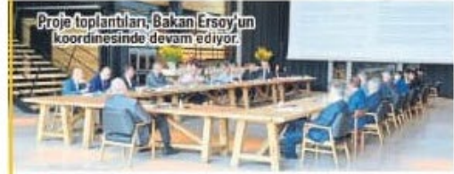
Proje toplantıları, Bakan Ersoy'un koordinasyonunda devam ediyor.